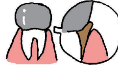
プラークが溜まり歯周病に