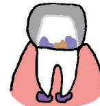
被せ物の土台の腐食 歯の根の部分に悪影響