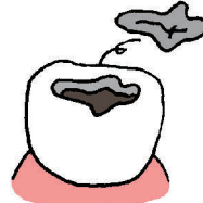
はずれやすくなる