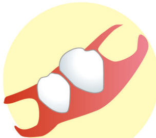
金属のバネが無い入れ歯