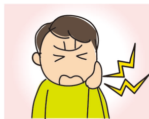
顎の付け根(顎関節)や その周辺が痛い