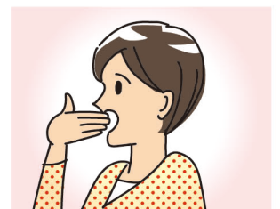
口が大きく開けられない ※指3本分、口が開かない