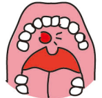
お口の中の傷や炎症