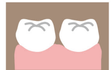
歯の隙間が広がった