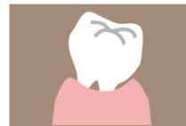
歯がグラグラする